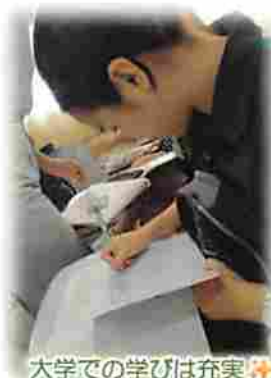
大学での学びは充実✪

学生生活では、知識を得るだけでなく責任感も身につきました。朝から昼まで授業を受け、その後にグループ課題に取り組むこともありました。