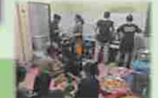
みんなで協力❤️食事の準備 デルフィも最後まで奉仕