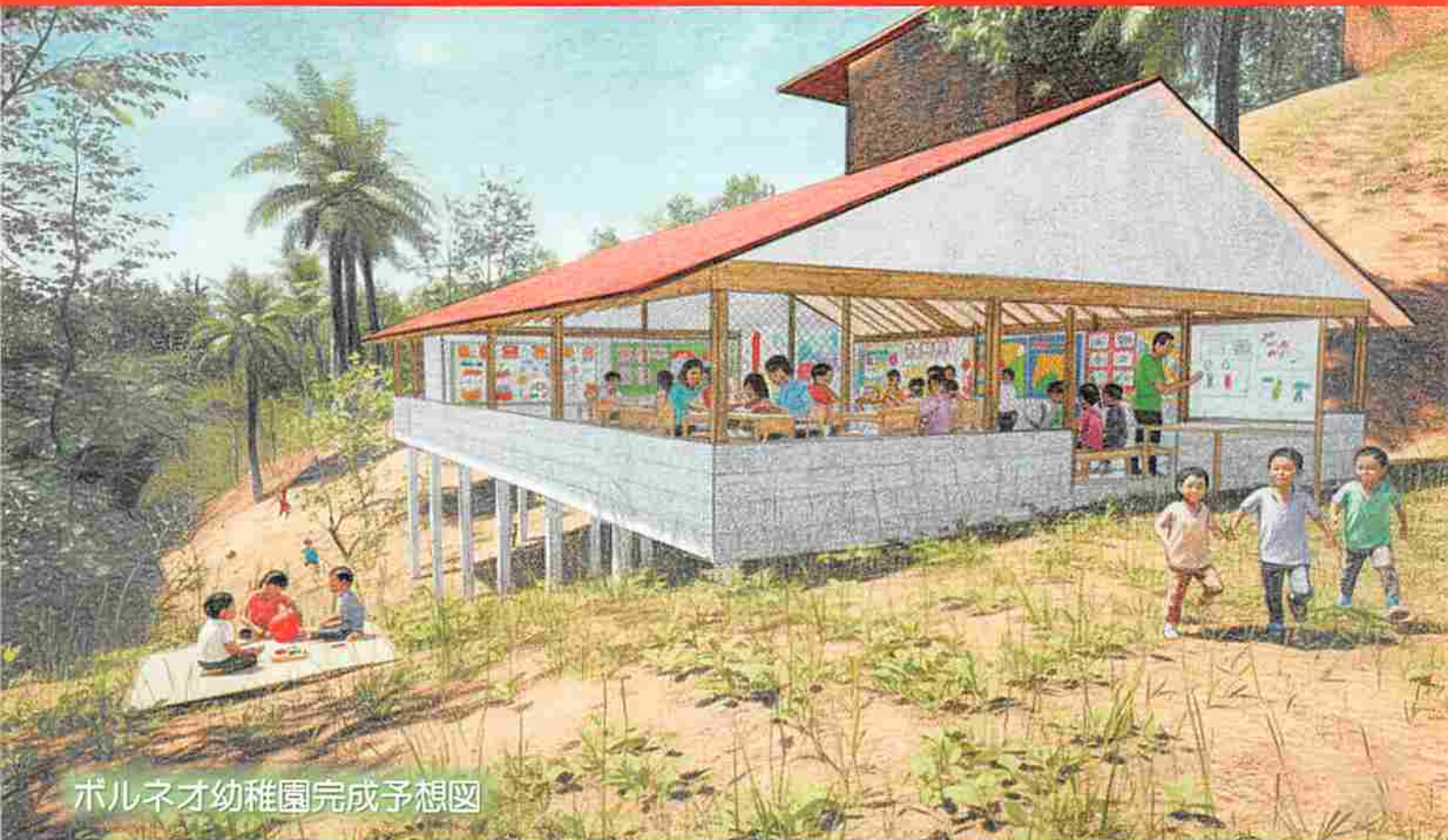
ボルネオ幼稚園完成予想図