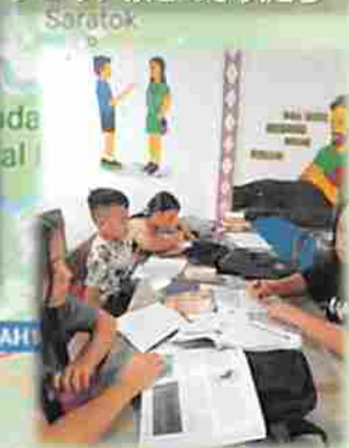
グロリア寮Ⅱの子供たち