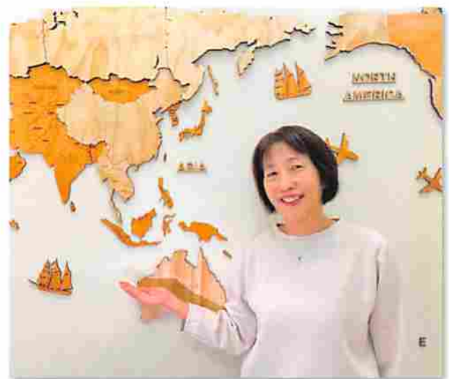
意外と近い!? 日本とインドネシア