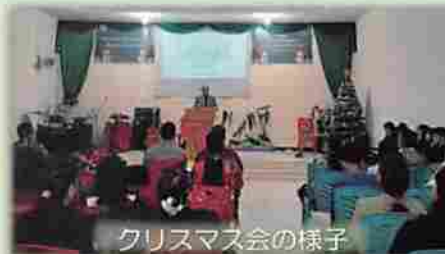
クリスマス会の様子